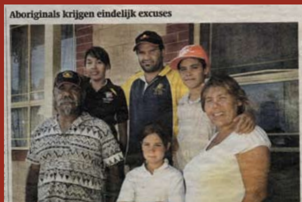
Foto: krantenartikel over excuses aan Aboriginals

Inheemse volken worden vaak gediscrimineerd door de dominante groep in het land waarin zij leven. Ze worden ofwel buitengesloten en kunnen dan niet deelnemen aan een samenleving (ze hebben bijvoorbeeld geen stemrecht of geen toegang tot voorzieningen als water, gezondheidszorg en onderwijs), of ze worden gedwongen op te gaan in de dominante cultuur. Zij moeten daarvoor dan hun eigen taal, cultuur en tradities opgeven.