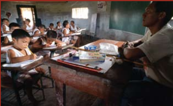
Foto: Senama kinderen, Bazilië die naar school gaan

Inheemse volken hebben vaak geen toegang tot onderwijs. Dit maakt hen kwetsbaar om deel te kunnen nemen aan de dominante samenleving. In andere gevallen wordt onderwijs juist gebruikt om inheemse volken 'op te voeden'. Alleen de nationale taal wordt gebruikt en de leerstof is niet afgestemd op de cultuur van de inheemse volken. Op deze manier gaat de traditionele kennis en de taal van deze volken verloren.