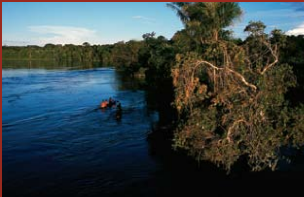
Foto: Yanomani dorp, Amazone Brazilië