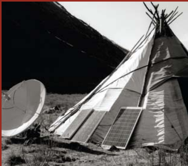
Dukha in Mongolië en Rusland

Inheemse volken hebben in het algemeen een andere visie op ontwikkeling dan de westerse dominante wereldvisie, die vooral gebaseerd is op economische groei door exploitatie van arbeid, kapitaal en grondstoffen. Voor inheemse volken staat veel meer een goed leven en evenwicht met de natuurlijke leefomgeving centraal. Dat betekent echter niet dat inheemse volken de westerse levensstijl volledig afwijzen. Zij willen zelf de keuze kunnen maken over welke weg van ontwikkeling zij zullen volgen.