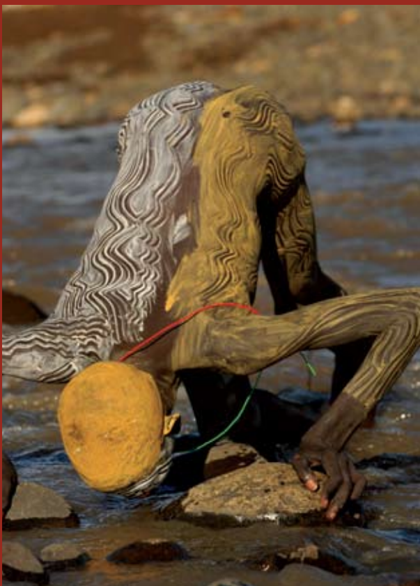
Surma, Ethiopië, jongen drinkt uit rivier