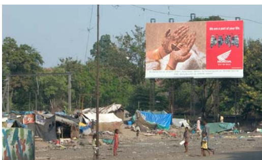
Billboard van een multinational bij een krottenwijk in India

Een andere belangrijke maatregel om eerlijke handel te bevorderen is de steun aan vakbondsorganisaties en andere particuliere organisaties (ngo's) wereldwijd. Vakbonden en ngo's spelen een belangrijke rol binnen internationale netwerken die lobbyen voor eerlijke handel. Vakbonden zijn organisaties met soms miljoenen leden die hun achterban kunnen oproepen tot grootschalige acties. Bovendien nemen vakbonden wereldwijd deel aan overleg met werkgevers en overheden en kunnen zij druk uitoefenen om de handel eerlijker te doen verlopen.