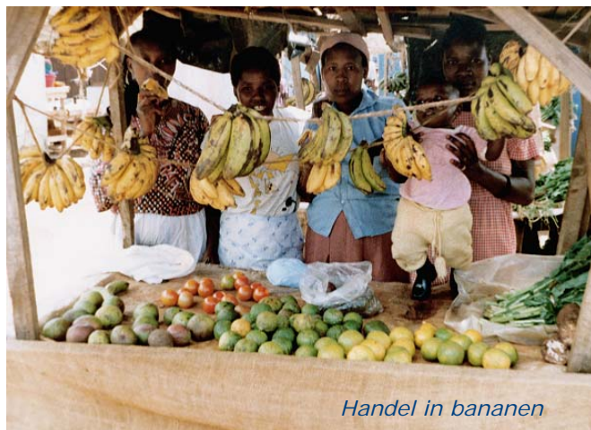
Handel in bananen

Een goede collage is niet makkelijk te maken. Want je moet maar net de teksten en foto's vinden die precies aansluiten bij wat jullie over eerlijke handel willen zeggen. Wat jullie niet kunnen vinden voor jullie collage kunnen jullie verwerken in een mondelinge toelichting. Jullie kunnen bijvoorbeeld laten zien welke verbeteringen in de handelsbetrekkingen tussen jullie land en het rijke westen hebben plaatsgevonden. Of welke verslechtingen, als dat aan de orde is.