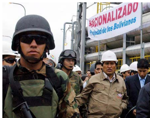
Morales bezoekt een olieraffinaderij die hij vlak daarvoor heeft onteigend

Ook andere (legale) succesvolle exportproducten hebben hun keerzijde. Bolivia is een belangrijke exporteur van olie, gas en tin. De winsten gingen tot voor kort voornamelijk naar de eigenaars: buitenlandse bedrijven. De gewone Boliviaan had daar niets aan. De nieuwe president van Bolivia, Morales, is overgegaan tot het nationaliseren (= onteigenen; de staat wordt dan eigenaar) van deze bedrijven. Deze nationalisaties hebben geleid tot grote onrust in het land zelf met scherpe tegenstellingen tussen de arme bevolking (die voor nationalisatie is) en ondernemers (die tegen zijn). De onlusten zorgen ervoor dat buitenlandse bedrijven zeer aarzelend zijn geworden om met Bolivia te handelen of in het land te investeren.