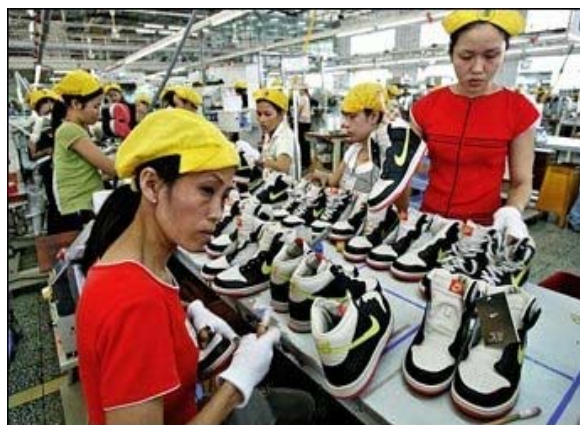
Nike-fabriek in Azië

Jullie kunnen met tekst en beeld ook een Powerpoint-presentatie maken. Met uitleg, jullie mening of met stellingen. Zorg ervoor dat de inhoud door de vormgeving goed de aandacht trekt. Daar gaat het tenslotte om.