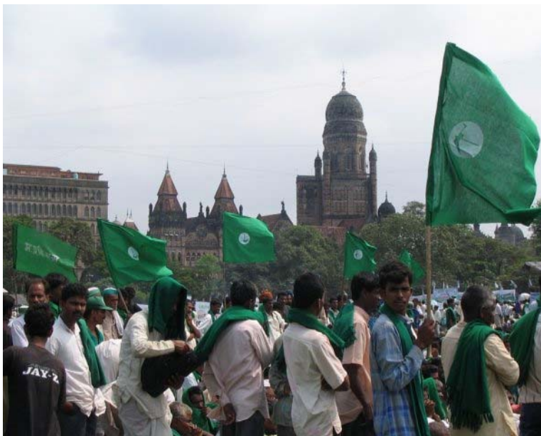
Boeren in India protesteren tegen oneerlijke handelspraktijken

Schrijf de rollen uit en oefen een keer van tevoren, voordat jullie het resultaat aan de klas vertonen.