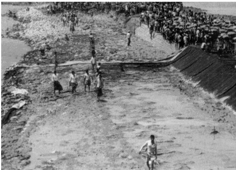
Bengalen aan het werk bij de aanleg van dijken

http://www.wereldwijs.nl/secure/nieuws/k20008/moesson.htm Wateroverlast in Bangladesh in 2000