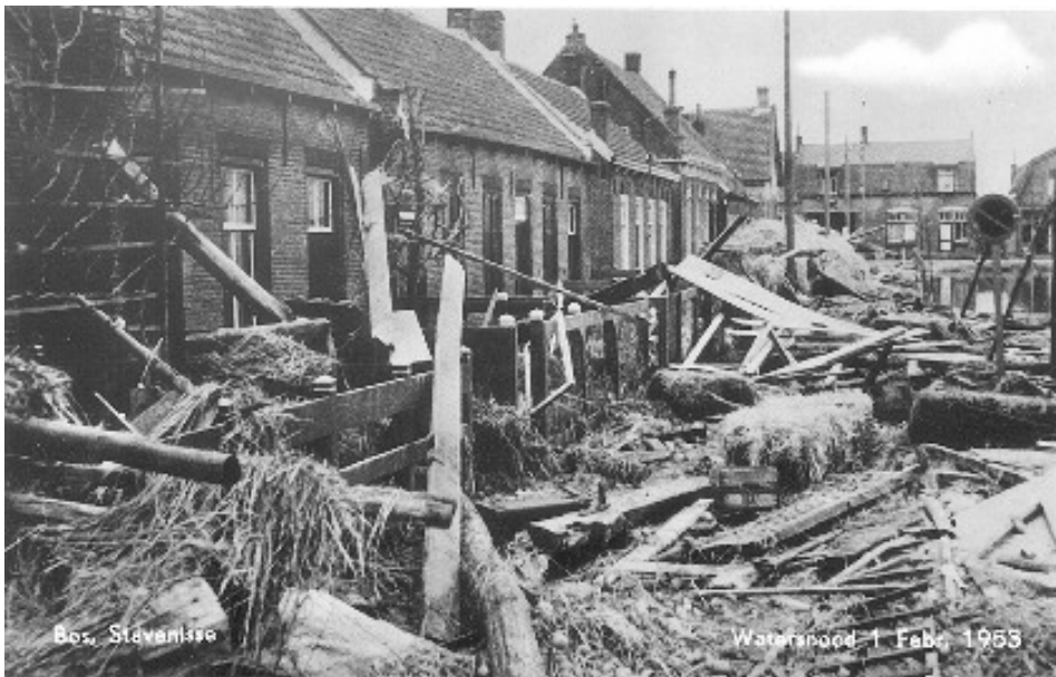
Stavenisse in Zeeland, op 1 februari 1953, na de watersnoodramp.

Het Nederlandse leger wordt ingezet om onder andere de kadavers van meer dan 10.000 dieren op te ruimen. De wereld is diep geschokt en helpt bij de wederopbouw. Giften en goederen stromen binnen. Engelse en Amerikaanse helikopters droppen eerst voedsel en later andere artikelen waar behoefte aan is boven de getroffen gebieden. In totaal zijn er meer dan 4.500 gebouwen verwoest. Zweden en Noorwegen leveren houten woningen, omdat hele dorpen opnieuw gebouwd moeten worden. Er zijn allerlei nationale acties om geld en goederen in te zamelen. Kinderen maken hun spaarpotten leeg. Het Franse voetbalelftal speelt een benefietwedstrijd tegen de in het buitenland wonende Nederlandse profvoetballers.