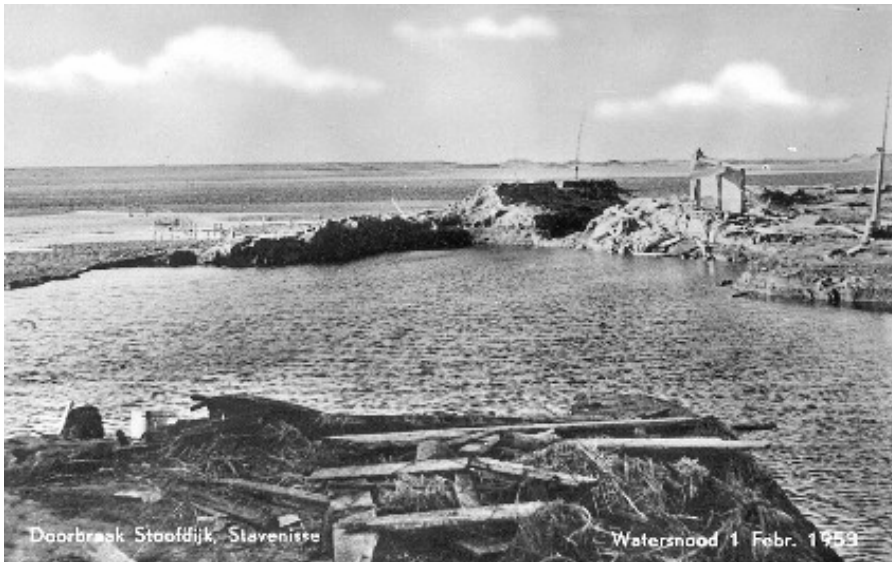
De Stoofdijk in Stavenisse, na de dijkdoorbraak, op 1 februari 1953.

Stormbrekers, duinen en dijken kunnen normale getijdenwisselingen, de wisseling tussen eb en vloed, makkelijk aan. Ook wanneer het water wat hoger komt. Dat gebeurt standaard bij nieuwe en volle maan. Maar stormvloed is een ander verhaal. Gemiddeld één keer per twee jaar is er een lage stormvloed . Het klinkt tegenstrijdig, maar een lage stormvloed is een extra hoge vloed gecombineerd met een storm. Die storm stuwt het water hoger op dan anders. Waarschijnlijk heet het lage stormvloed, omdat er ook hoge stormvloed en kunnen voorkomen, stormvloed en met een nóg hogere vloed. Dat gebeurt niet zo vaak. Een keer per honderd tot duizend jaar is er een hoge stormvloed.