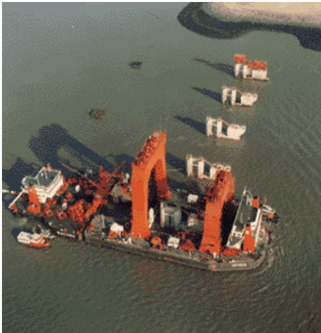
Oosterschelde-stormvloedkering. Materieel te water: de Ostrea bij het plaatsen van de pijlers voor de stormvloedkering

Er komt een stormvloedkering in de Hollandse IJssel (1958). Vervolgens worden de Zandkreekdam (1960), de Veerse-Gatdam (1961), de Grevelingendam (1965), de Volkerakdam (1969), de Haringvlietdam met sluisen (1971), de Brouwersdam (1972) en de Ooster- en Philipsdam, die deel uitmaken van de Oosterschelde-stormvloedkering (1989), aangelegd. Door het toepassen van een halfgesloten dam, met een beweegbare stormvloedkering, wordt de Oosterschelde niet helemaal afgesloten; daardoor blijven de bewegingen van eb en vloed behouden. Het water van de Oosterschelde zou bij een compleet afgesloten Oosterschelde van zout water zoet water worden en dat zou teveel veranderingen aan natuur en milieu toebrengen.