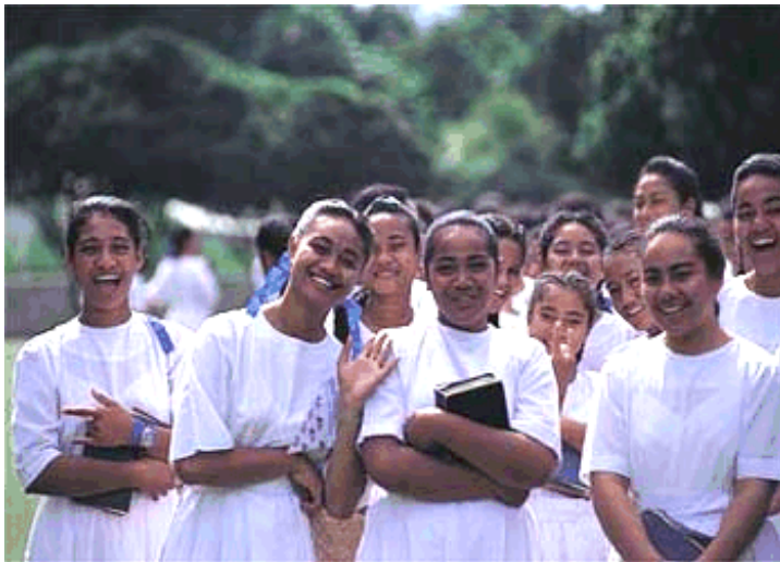
Gewone burgers van Tonga met een lage mana

Wanneer was een persoon, plek of ding taboe? Dat hing af van hoeveel mana het had. Mana was een bovennatuurlijke kracht. De goden en alle mensen, plekken en dingen hadden mana.