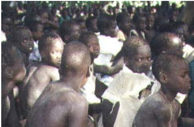
Jongetjes te koop op een slavenmarkt in Soedan

Ook al is slavernij nu in alle landen officieel afgeschaft, het bestaat nog steeds. En het bestaat wereldwijd. In de krant lees je af en toe over een schip met slaven dat op zee of in een haven wordt aangetroffen. 14 april 2001 was er zo'n bericht. Volgens het Afrikaanse persbureau PANA probeerden handelaren tweehonderd kinderen van boord te zetten in Gabon en Kameroen. De kinderen kwamen uit Benin en zouden moeten werken in de huishouding of op plantages.