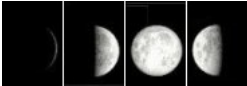
Van links naar rechts: nieuwe maan, eerste kwartier, volle maan en laatste kwartier

De eerste kalenders zijn op de bewegingen van de maan gebaseerd. Aan de hemel ziet men nieuwe maan, eerste kwartier, volle maan en laatste kwartier.