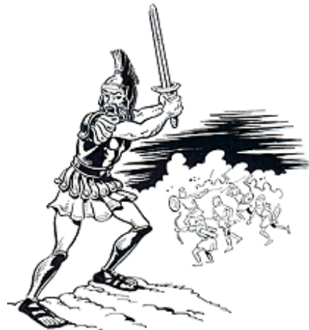
De god Mars