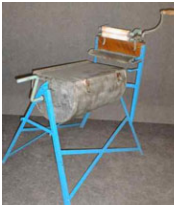
Wasmachine uit 1910