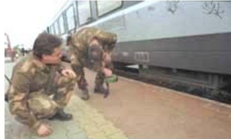
Strengere controle aan de buitengrens

Grenzen kunnen ook steeds meer een belemmering worden. Dat is bijvoorbeeld gebeurd waar landen van de EU grenzen aan landen die géén lid zijn. Eerst kon je makkelijk vanuit Wit-Rusland of de Oekraïne de grens met Polen over. Je had een paspoort nodig en die moest je laten zien aan de grens, maar dat was alles. Toen afgesproken werd dat Polen lid van de EU zou worden, moest Polen de grens met Wit-Rusland en de Oekraïne streng gaan bewaken. Nu moeten mensen in Wit-Rusland en de Oekraïne voortaan eerst een visum aanvragen voordat ze Polen (of een ander land van de EU) binnen mogen. Dat is een papier waarop staat dat je een bepaald land binnen mag. Ben je in Polen (of een ander land van de EU) en je hebt géén visum, dan kom je in een soort gevangenis dat uitzetcentrum heet. Daarna wordt je naar je eigen land teruggestuurd.