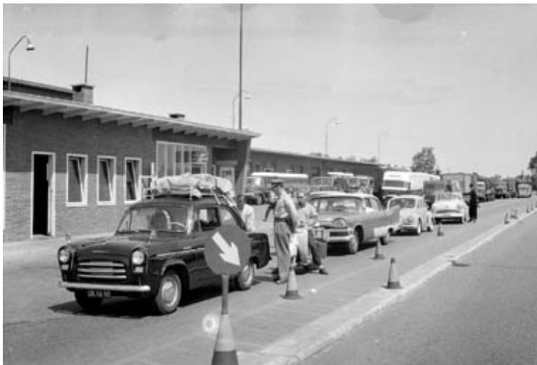
Grenscontrole in 1957. Nederlandse toeristen worden gecontroleerd op smokkelwaar (boter, sigaretten)

Mensen die zaken deden over de grens, moesten vaak invoerrechten betalen als ze goederen uit het buitenland invoerden. Wilden ze dat niet, dan lieten ze goederen waar invoerrechten op geheven werden, over de grens smokkelen. Daar spaarden ze geld mee uit en smokkelaars verdienden er zelf aan. Een voorbeeld: In België was boter lange tijd duurder dan in Nederland. Belgen die boter invoerden uit Nederland moesten daarvoor invoerrechten betalen zodat Nederlandse boter in België tóch duur werd. Smokkelaars smokkelden Nederlandse boter over de grens om daar te verkopen.