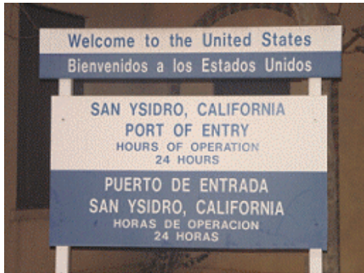
Bord langs de grens tussen Amerika en Mexico

Misschien heb je bij opdracht 1 als antwoord 'landen' gegeven. Daar gaan we het ook over hebben. We noemen grenzen tussen landen landsgrenzen. De landsgrens van Nederland wordt ook wel Rijksgrens genoemd. Misschien heb je je wel eens afgevraagd: waarom is een grens juist dáár gelegd en niet ergens anders? Je krijgt daar al een idee van als je een kaart met landsgrenzen van een groot gebied vergelijkt met een kaart van hetzelfde gebied met gebergten, moerassen, woestijnen en bossen. Dat zijn moeilijk toegankelijke gebieden. Dan zie je dat landsgrenzen soms langs of door zulke gebieden lopen. Ook loopt een landsgrens