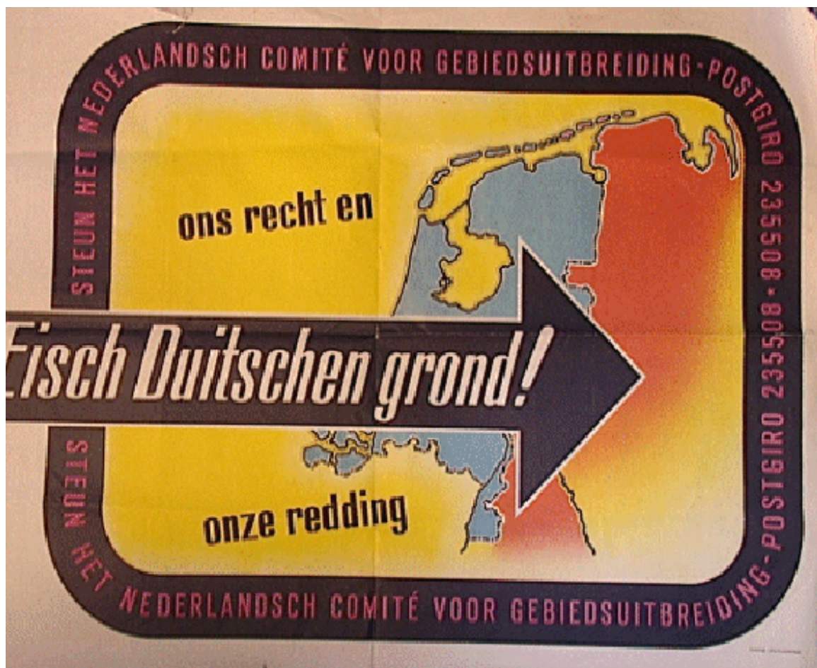
Eisch Deutschen grond! Affiche van het Nederlandsch Comité voor Gebiedsuitbreiding

Na de bevrijding wilden sommige Nederlanders Duitsland daarvoor laten betalen. Dat waren vooral mensen die verzet hadden gepleegd tegen het Duitse bestuur van Nederland. Met geld kon dat niet, want Duitsland was berooid en had helemaal geen geld. Daarom wilde men dat Nederland stukken land van Duitsland die aan Nederland grenzen, zou afpakken als schadevergoeding. Volgens de meest vergaande plannen hiervoor zou Nederland er op die manier 10.000 km 2 land bij krijgen. Dat is bijna éénderde van het oppervlak dat Nederland nu heeft, 33.833 km 2 .