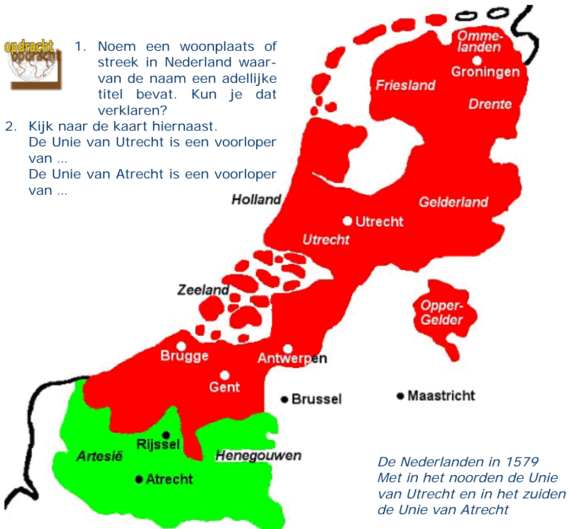
De Nederlanden in 1579 Met in het noorden de Unie van Utrecht en in het zuiden de Unie van Atrecht