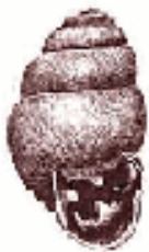
Het huisje van de illustere zegge-korfslak

korenwolf leven tussen de fabrieken? Nee, dus. Maar moeten ze dan maar verdwijnen?