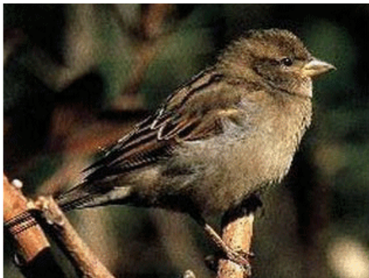
Huismus op de Rode lijst