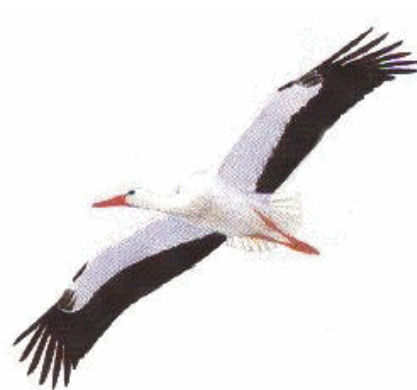
Ooievaar van de Rode lijst af