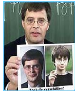
Premier Balkenende tijdens het interview met het jeugdjournaal

Op 1 april 2003 bracht het jeugdjournaal het bericht naar buiten dat premier Balkenende, van wie gezegd wordt dat hij zoveel op Harry Potter lijkt, in de volgende film over Harry Potter, 'De gevangene van Azkaban', de vader van Harry Potter zou spelen. Balkenende speelde het spelletje mee en liet zich voor de camera interviewen.