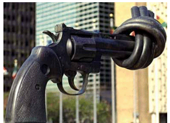
Standbeeld voor het VN-gebouw

Veel wapens hebben geen code waarbij men kan zien wie de fabrikant is, wie de koper is en wie de exportlicentie heeft uitgevaardigd. Zolang die codering niet bestaat, is de illegale handel in kleine wapens moeilijk tegen te gaan.