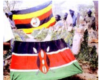
30 jaar grensoverschrijdende vrede: ceremonieel begraven van wapens

Op 14 november, 2003 viert een aantal Matheniko- en Turkana-leefgemeenschappen 30 jaar grensoverschrijdende vrede tijdens de ceremonie 'het begraven van de strijdbijl'. Ze herdenken de vredesovereenkomst tussen hun stamoudsten Apaloris en Ekyeno. Die begraven in 1973 letterlijk en figuurlijk de wapens. De vrede wordt beklonken door bezoeken over en weer, waarbij de vrouwen voor de gasten koken. Daarmee geven de vrouwen aan dat ze het met de overeenkomst eens zijn. Na de maaltijd wordt er gedanst en gezongen. Ook daarmee wordt de wil tot vrede aangegeven.