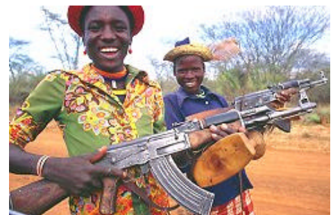
Karamojongkrijgers anno 2004

Vanaf de jaren 70' komen er nog veel meer wapens in omloop. In 1986 wordt de beruchte Oegandese dictator Idi Amin afgezet. Zijn soldaten slaan op de vlucht. Een wapenopslagdepot in Karamoja blijft onbeheerd achter. De Karamojong grijpen hun kans en maken 60.000 kleine wapens buit. Ze gebruiken de geweren voor veediefstallen. Die worden frequenter en steeds gewelddadiger. De krijgers stelen niet alleen van elkaar maar ook van hun burens over de grens in Kenia en Soedan.