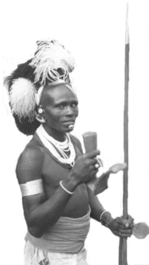
Pokot krijger rond 1960

We hebben Karamoja als casestudy genomen omdat de streek al jaren synoniem is met geweld en vrijwel elke jongen boven de dertien er met een wapen rondloopt. En dan niet de traditionele wapens zoals de speer en pijl en boog, maar moderne kleine wapens als de Kalashnikov. Hoe is het zo gekomen?