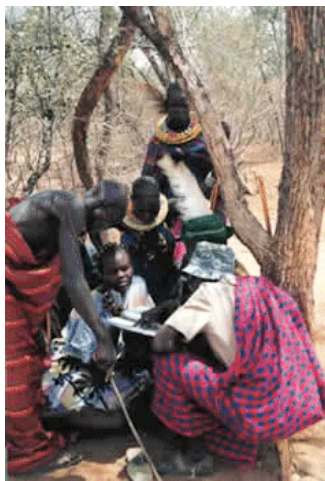
Overleg; het wapen tegen wapens

Deze vredesovereenkomst geldt als voorbeeld hoe lokale leiders, gesteund door de vrouwen, een rol kunnen spelen in het vredesproces. Een andere belangrijke voorwaarde voor vrede is de verbetering van de levensomstandigheden. Veel vredesinitiatieven bestaan dan ook uit een combinatie van overleg tussen gemeenschappen en ontwikkelingsprojecten. De CAPE Unit (Community based Animal Health and Participatory Epidemiology Unit) is daarvan een voorbeeld. De organisatie traint Karamojongvrouwen in vredesbemiddeling en zet tegelijkertijd projecten op om de veeziektes te bestrijden.