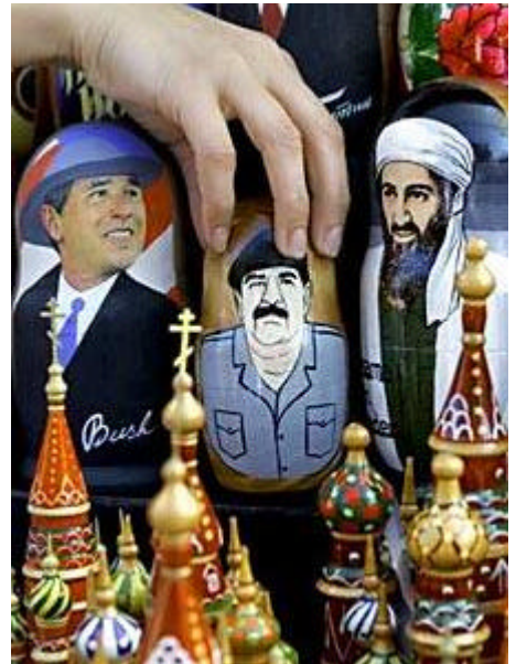
Russische Matroesjkapoppen van Bush, Hoessein en Bin Laden

Directeur van een middelbare school in Amsterdam, Trouw van 18 maart 2003