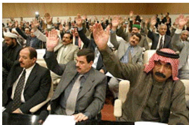
Stemming over resolutie 1441

In werkelijkheid ligt het een stuk minder simpel. Heeft de Veiligheidsraad nu wel of niet een bevel gegeven? De Amerikanen, Britten en Spanjaarden zeggen dat het bevel af te leiden is uit resolutie 1441 (waarin Irak wordt gewaarschuwd voor 'ernstige gevolgen' als het land doorgaat met het niet nakomen van zijn verplichtingen = ontwapenen); de Fransen, Russen, Duitsers en anderen die een zetel in de Veiligheidsraad hebben, verwerpen deze interpretatie. En zelfs een begrip als zelfverdediging is minder simpel dan het lijkt. Hugo de Groot schreef in 1625 al dat een preventieve aanval op een andere staat met duidelijke vijandige bedoelingen ook tot zelfverdediging mag worden gerekend.