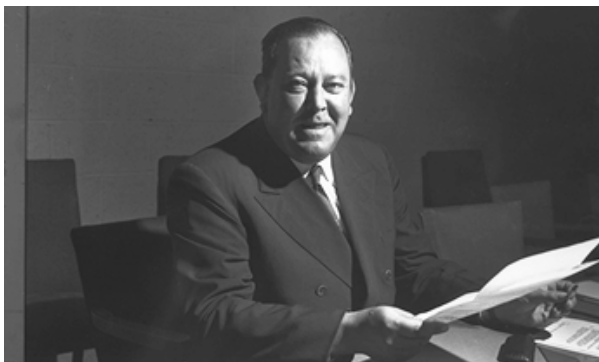
De hoogste functie bij de VN is die van secretaris-generaal. Op dit moment is dat Kofi Annan. Op de foto hierboven staat de eerste secretaris-generaal de Noor Trygve Lie (1946-1952).

Heel belangrijk in de VN is de Veiligheidsraad, zeker als het gaat om gewapende conflicten tussen staten. De Veiligheidsraad heeft 15 leden, waarvan vijf permanent. De overige 10 worden gekozen door de Algemene Vergadering voor een periode van 2 jaar. De permanente leden hebben vetorecht.