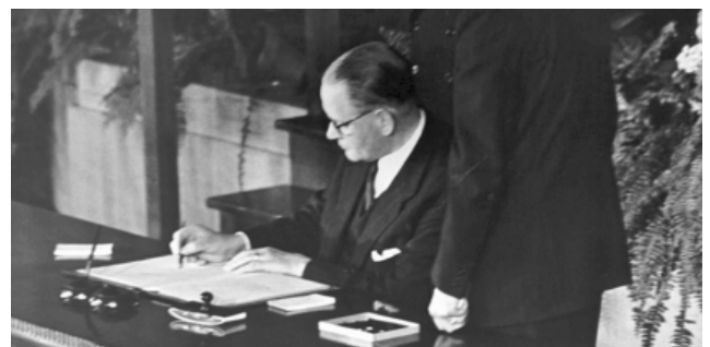
Mr. Dirk Stikker (minister van Buitenlandse Zaken) ondertekent het NAVO-akkoord voor Nederland.

Op dit moment heeft de NAVO 19 leden. Met nog eens 27 staten bestaat een zogenaamde partnerschapsrelatie. Bijzonder is dat sinds de val van het 'IJzeren Gordijn' ook de Oost-Europese landen, de vroegere vijand, tot de NAVO-partners behoren.