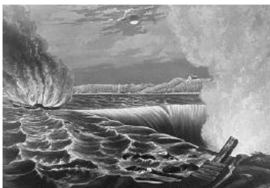
De Caroline werd vlak voor de Niagara waterval in brand geschoten, maar ging niet over de rand

De terroristische aanslagen op 11 september door Al Qa'ida in New York en Washington hebben het wereldbeeld van de Amerikanen veranderd. Amerika voelt zich niet meer bedreigd door ideologieën zoals het communisme of het fascisme, maar door terroristische groeperingen. Los van de vraag of Irak en de terroristische organisatie Al Qa'ida samenwerken (het bewijs is nooit geleverd), komen de Amerikanen tot de conclusie dat het laten voortbestaan van regimes die terroristen zouden kunnen steunen te groot is. Een succesvolle omverwerping van het Iraakse regime kan andere landen die (ook) tot steun aan terroristen geneigd zijn, aansporen terroristen in eigen land niet te steunen maar te bestrijden, zo is de redenering.