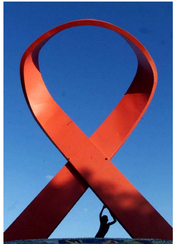
Het aidsmonument in Durban (Zuid-Afrika)

Voor de meeste millenniumdoelen hebben de VN aangegeven wat elk land moet doen om dit millenniumdoel te halen. Bij die doelen is gekeken naar de situatie in 1990 en wordt in procenten aangegeven wat landen moeten doen: extreme armoede moet per land in 2015 met 50% zijn teruggedrongen ten opzichte van 1990; kindersterfte met 66% en moedersterfte zelfs met 75%. Voor het tegengaan van de verspreiding van hiv/aids wordt slechts gesproken van een 'aanzienlijke vermindering'. Nergens staat omschreven wat een 'aanzienlijke vermindering' is. Is dat 10%, 25%, 50% of zelfs meer? Het lijkt erop dat de VN al tevreden zijn als de jaarlijkse groei van het aantal mensen met hiv en aids tot stand kan worden gebracht en de lijn weer omlaag kan worden gebogen.