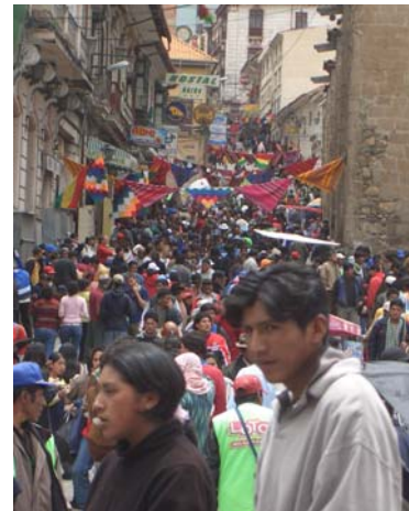
Maar weinig Bolivianen zijn besmet met hiv

Lees meer, ga naar www.cmo.nl/pjb . Kies land en onderwerp.