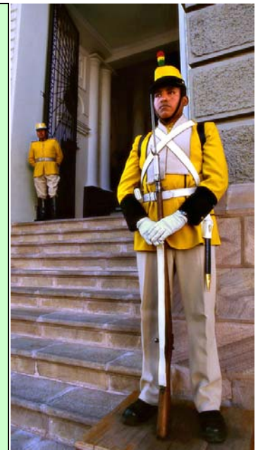
Ook paleiswachten moeten veilig vrijen!

Een groep die speciale aandacht verdient is het leger. Soldaten zijn vaak tussen de 17 en 24 jaar oud en seksueel actief. Ze zijn afkomstig uit verschillende delen van het land en uit verschillende bevolkingsgroepen. Ver van huis gelegerd voelen zij zich eenzaam en ontstaat seksuele spanning. Samen met het gebrek aan voorlichting en de machismo-houding dat het stoer is om risico's te nemen, levert dat gevaar op. Ook wordt er in het leger veel gedronken en is geweld normaal. De kans om aids op te lopen is in het leger twee tot vijf keer zo groot als bij gewone burgers. Door onwetendheid en door vooroordelen staan soldaten er vaak niet bij stil dat zij zelf aids zouden kunnen krijgen. In 2006 startten de Verenigde Naties en het Boliviaanse leger een voorlichtingscampagne, die het leger tot voorbeeld moet maken op het gebied van aidspreventie. Duizenden officieren stemden erin toe vrijwillig een aidstest te ondergaan. Daarmee wordt het bestaan van aids binnen het leger erkend en wordt erop gewezen dat het ook een werkelijk gevaar vormt. Voorgelichte soldaten moeten hun kameraden op de hoogte brengen en de boodschap doorgeven: vrij veilig, gebruik condooms.