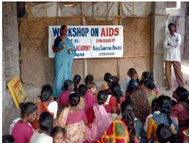
Aidsworkshop voor vrouwen

De regering van India vindt het belangrijk dat aan de aidsepidemie een halt wordt toegeroepen en stimuleert de verspreiding van aidsmiddelen. Daarvoor hoeft het land geen dure medicijnen in te voeren. Integendeel: India is in staat om zelf medicijnen tegen aids te produceren en tegen lage prijzen op de markt te brengen. Indiase onderzoekers doen proeven om vaccinatie tegen hiv, het virus dat aids veroorzaakt, mogelijk te maken.