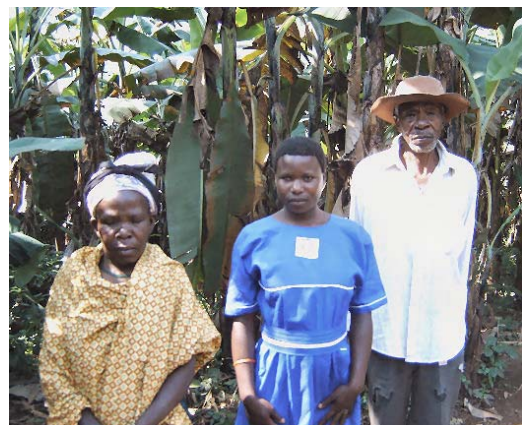
Grootouders krijgen de zorg voor hun kleinkinderen

De leeftijdsgroep die seksueel het meest actief is, loopt het grootste gevaar besmet te raken. In Oeganda zijn veel mensen in de leeftijd van 18-40 overleden. Dit betekent dat het land het zonder hun werkkraft en vitaliteit moet doen. En er is nog een ander groot probleem: ze hebben tot nu toe meer dan een miljoen wezen nagelaten. In het gunstige geval worden de kinderen opgevangen door hun familie of bevriende bureu. Maar er zijn grenzen aan het vermogen van de familie of goedwillende bureu. Als je zelf al de zorg voor een gezin hebt, is het niet gemakkelijk om andere kinderen erbij te nemen. En stel je eens voor. In Oeganda zijn kinderen een soort verzekering voor de oude dag. Als je oud wordt, zijn je kinderen en om voor je te zorgen. Maar dan overlijden al je kinderen en blijf je achter met de zorg voor de kleinkinderen.