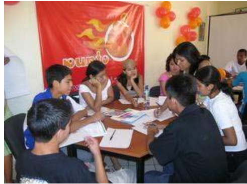
Jongeren discussiëren over aids

Aids is voor deze organisaties iets dat door het westen is geïntroduceerd. Buitenlandse toeristen en Marokkaanse migranten die in het westen wonen en werken en in Marokko hun vakantie doorbrengen krijgen de schuld van de stijging van het aantal hiv-besmettingen. Hoe dan ook, de kennis onder de bevolking over hiv/aids laat te wensen over en veel besmettingen worden niet of te laat opgemerkt.