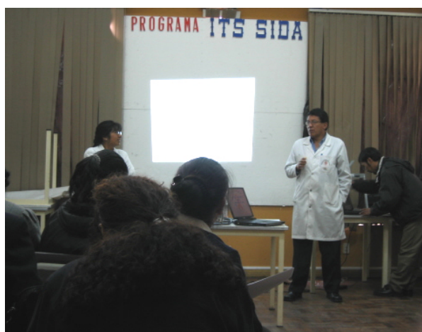
Voorlichting: aids heet in Bolivia sida

Er moet nog veel gebeuren op het gebied van voorlichting. Condooms gebruiken is een probleem: de kerk is ertegen en het past niet binnen de machismo-cultuur (overdreven mannelijk, stoer zijn). Verder zijn veel mensen wel besmet, maar niet geregistreerd. Dat betekent dat niemand er zicht op heeft en dat deze groep een wandelende tijdbom kan zijn. De regering lijkt het gevaar te onderschatten en onderneemt weinig. Voor mensen die hiv hebben, is er geen garantie dat zij de medicijnen krijgen die zij nodig hebben.