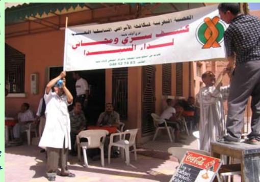
Ophangen van een spandoek dat de komst van de karavaan aankondigt

Stichting Aknarij is een Marokkaanse jongerenorganisatie die zich inzet voor Marokkanen in Nederland. Aknarij wil ook een bijdrage leveren aan de ontwikkeling van Marokkanen in Marokko zelf. In 2005 heeft Aknarij ter gelegenheid van 400 jaar betrekkingen tussen Nederland en Marokko een 40-dagen durende campagne gevoerd in het Zuiden van Marokko. Doel van deze campagne was de grotendeels analfabete bevolking te informeren over de problemen rondom aids en de mensen bewust te maken van de risico's van soa's (=seksueel overdraagbare aandoening). De voorlichtingskaravaan startte met een conferentie waarin het huidige beleid van de Marokkaanse overheid ter discussie werd gesteld. Daarna trok de karavaan langs 10 steden en dorpen in het zuiden van Marokko. Een onderdeel van de voorlichtingscampagne was een theaterstuk genaamd "Les masques sont tombés" (= De maskers zijn gevallen). Met deze voorstelling probeerde men op een begrijpelijke en toegankelijke manier informatie over hiv/aids te geven en taboes te doorbreken. De theatervoorstelling werd verzorgd door de partnerorganisatie LMLIST (Ligue Marocaine de Lutter contre les IST = Marokkaanse Liga voor Bestrijding van soa's),