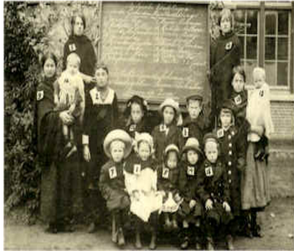
Belgische vluchtelingenkinderen die tijdens de Eerste Wereldoorlog hun ouders zijn kwijtgeraakt in Bergen op Zoom

Ons land heeft altijd vluchtelingen opgevangen. Tijdens de Eerste Wereldoorlog (die duurde van 1914 tot 1918) vluchtten veel Belgen naar ons land omdat Nederland neutraal bleef (niet aan de oorlog meedeed). In de jaren voor de Tweede Wereldoorlog vluchtten veel Duitse joden naar ons land op de vlucht voor de nazi's. Na de oorlog nam Nederland vluchtelingen uit Hongarije op toen Rusland dat land binnenviel. En nog maar enkele jaren geleden moesten veel Nederlanders in het rivierengebied hun huis en haard verlaten vanwege de dreiging van een dijkdoorbraak. Ook zij waren (tijdelijk) vluchteling.