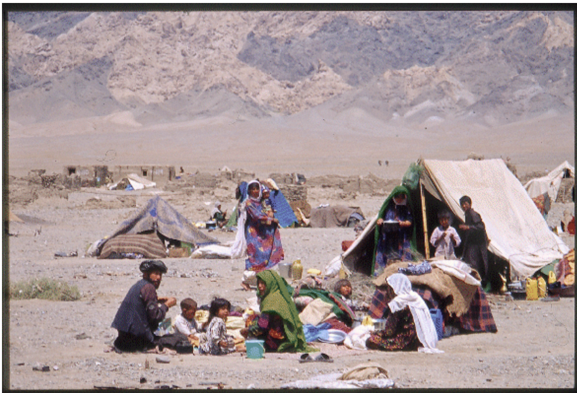
Vluchtelingenkamp nabij de Afghaanse stad Herat