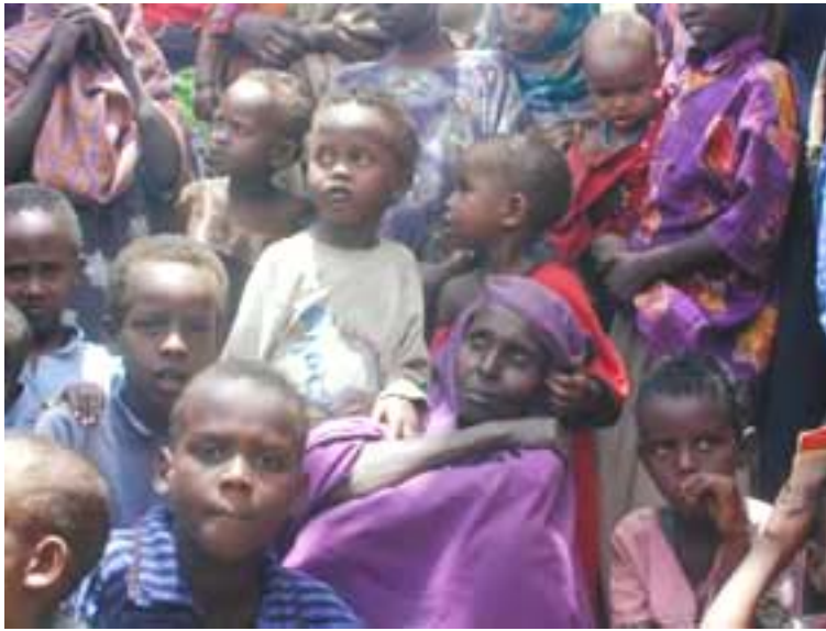
Somalische vluchtelingen in het vluchtelingenkamp Dadaab in het noorden van Kenia

De meeste vluchtelingen blijven dicht bij huis. Het is heel moeilijk om over afstanden van duizenden kilometers te vluchten. Daarvoor heb je bijvoorbeeld een auto nodig. Of geld voor een kaartje voor de trein, de boot of het vliegtuig.